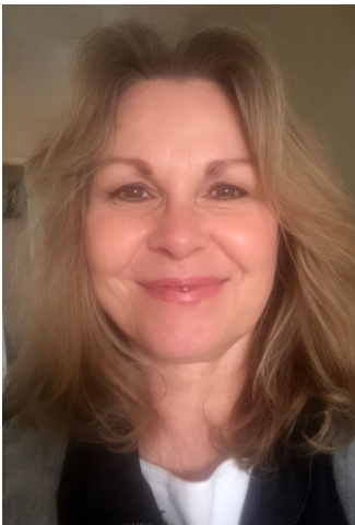
Por Judy Van Cleave, secretária, Fundação Urântia, Idaho, Estados Unidos