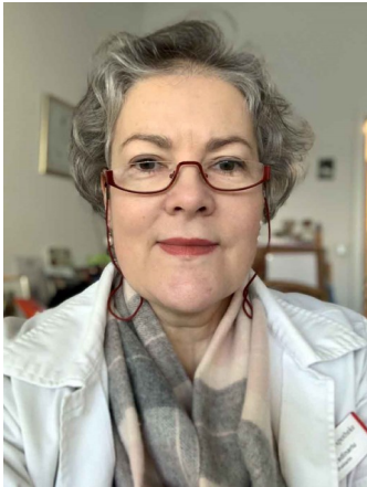
Por Mirela Gradinariu-Kelpin, Sulzbach, Alemanha

O que O Livro de Urântia significa para mim? Posso responder melhor a esta pergunta descrevendo o efeito que ele teve sobre mim.