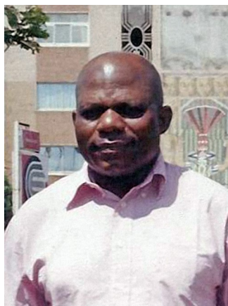
Di Paul Tsekar, Camerun

Io vorrei condividere la mia esperienza sulla scoperta, condivisione e studio del Libro di Urantia .