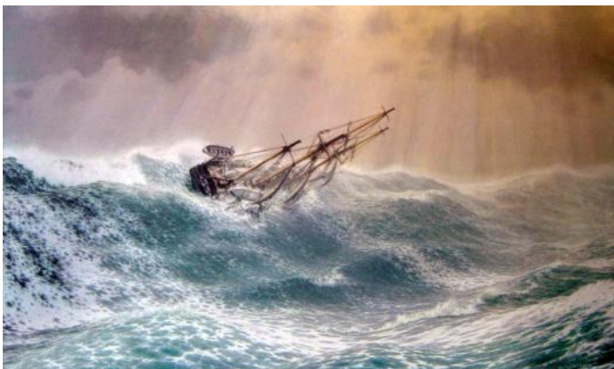
"Sorely Tried", HMS Beagle ao largo do Cabo Horn, em 12 de janeiro de 1833, por John Chancellor

5. Precisamos expandir as ferramentas da internet para a leitura, ensino e partilha do Livro de Urântia .