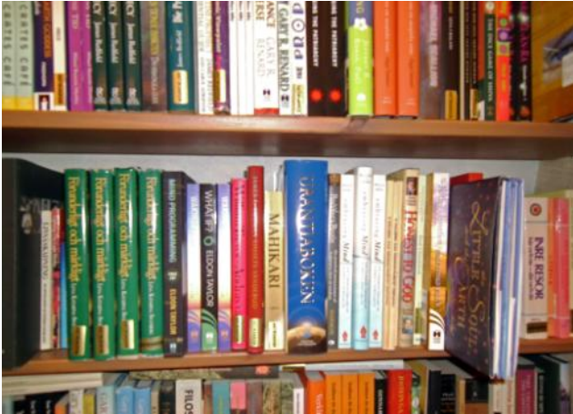
Urantiaboken nas prateleiras da Vattumannen - livraria de Estocolmo, Suécia . Vendas: alguns livros por mês.