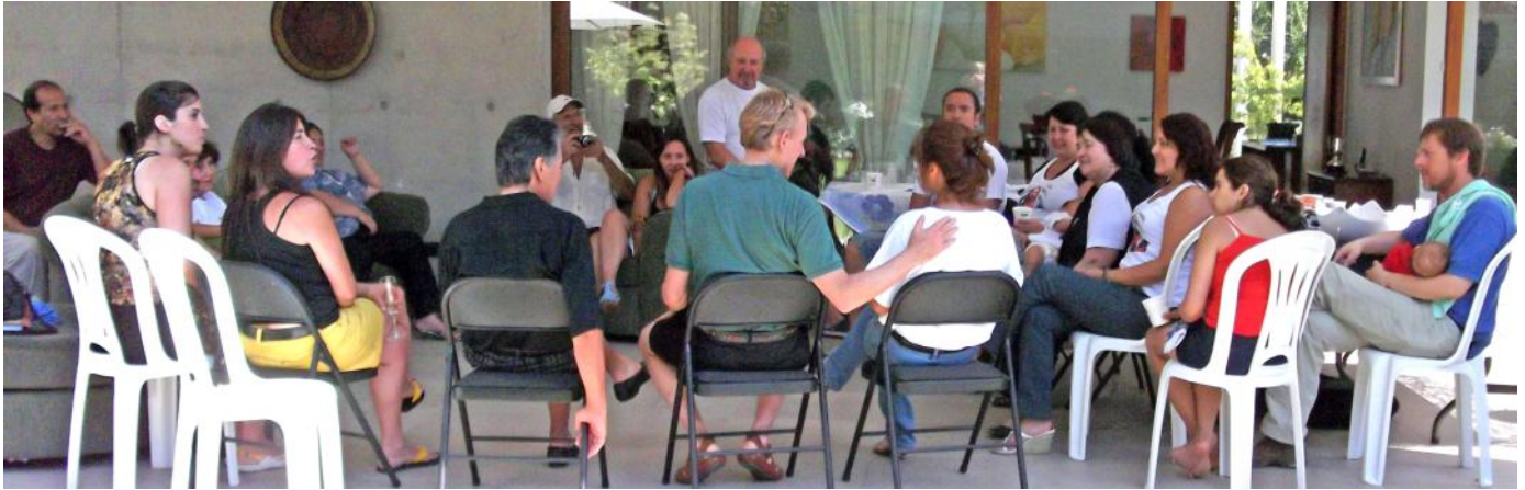
Discutindo os ensinamentos do Livro de Urântia com leitores de Santiago

o nosso distribuidor na América Latina por USD$10.