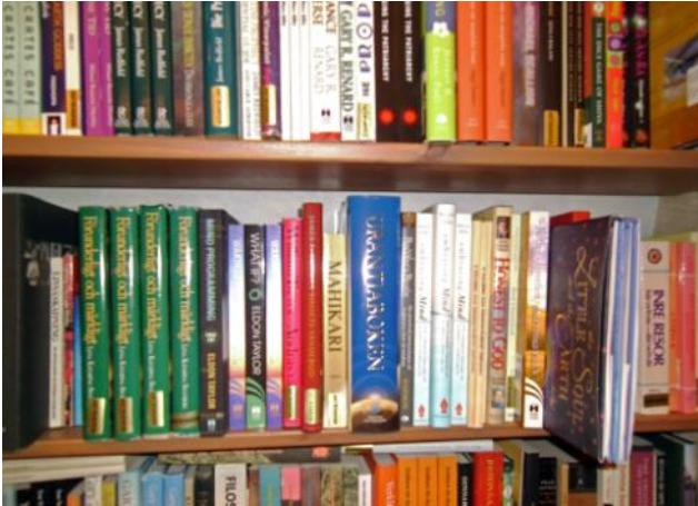
Urantiaboken Vattumannenin hyllyssä. Kirjakauppa sijaitsee Tukholmassa, ja se myy muutaman kirjan kuukausittain.