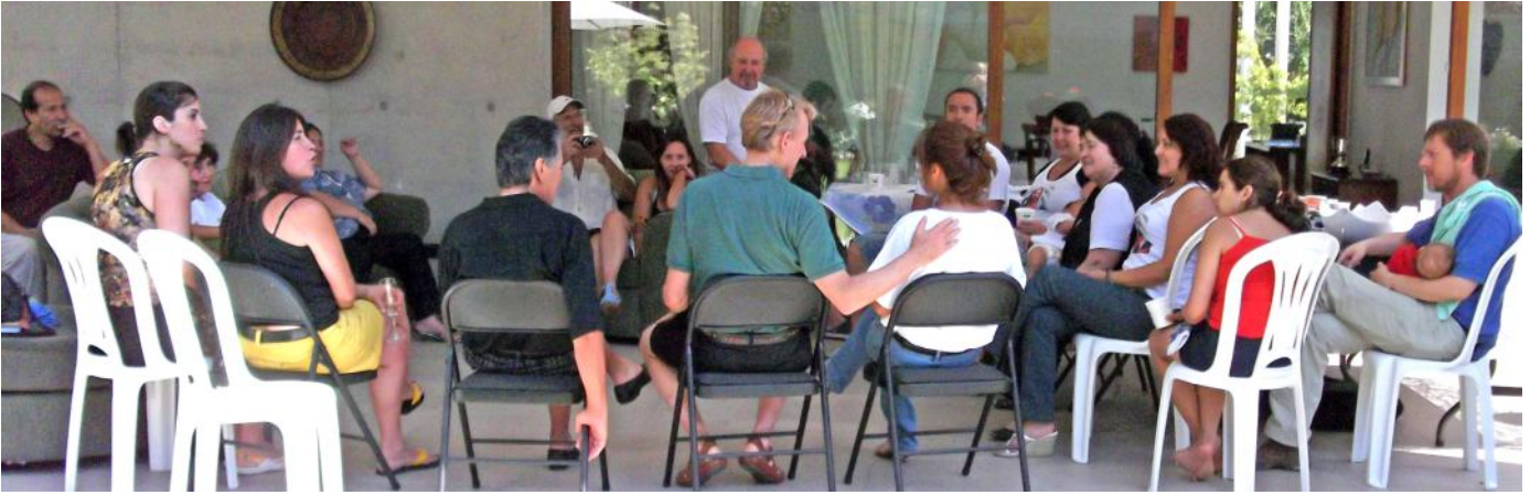
Keskustellaan Urantia-kirjan opetuksista santiagoalaislukijoiden kanssa

latinalaisamerikkalaiselle kirjatakulle 7,70 eurolla.