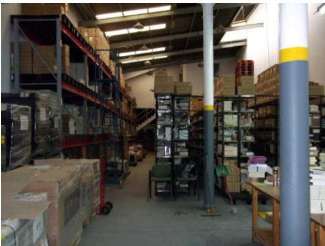
Kirjatukkukaupan varasto Argentiinassa