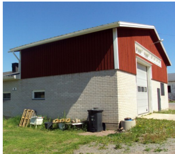
Suomenkielisten kirjojen varasto

työstään ruotsinnoksen parissa samoin kuin hänen kaikista muista toimistaan Urantia-kirjan levittämiseksi Suomessa vuoden 1966 jälkeen