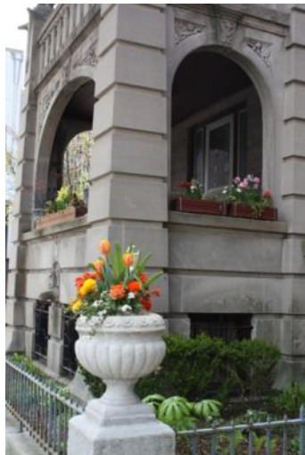
533 W Diversey Parkway