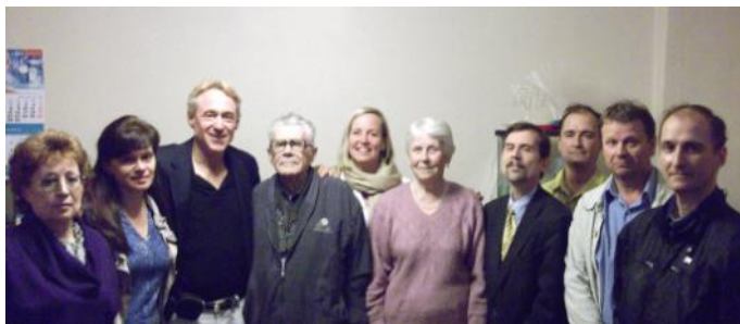
Встреча с русскими читателями

Трудно выразить в словах мои чувства о встрече с российскими читателями. Удивительно было видеть радость на их лицах, потому что они знают о Хавоне, что они мечтают о лучшей жизни, что они читают истории Михаила Небадонского и знают Отца на собственном опыте. Это делает всю нашу работу и финансовые расходы стоящими. Только вообразите, как наши невидимые наблюдатели следят за продвижением Урантийского Откровения в России. Мы не одиноки в этой миссии и усилия по построению духовного фундамента для более безопасного мира требуют постоянного преобразования религиозной свободы в России.