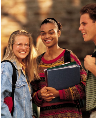
Volumen 2, número 3, septiembre 2008

Fundación Urantia 533 Diversey Parkway Chicago, IL 60614 EEUU